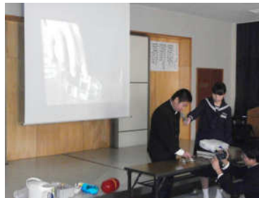
< 3 年 A 組：性の指導 >

12 / 2 (月) 学校保健委員会が開かれました。当日は薬を水で飲む理由を、実験を交えながら、わかりやすく説明してくれました。また、クイズ形式にした問題が、とてもわかりやすく、最後まで集中してお話を聞くことができました。保健委員の皆さん、ありがとうございました。