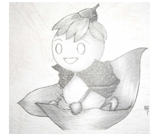
桜中マスコット 「さくらちゃん」

本校の教育課題 ・主体性の育成 ・確かな学力の育成 ・社会性・豊かな感性の育成 ・たくましさしなやかさとの育成 ・思いやりの育成 ・家庭・地域等との連携